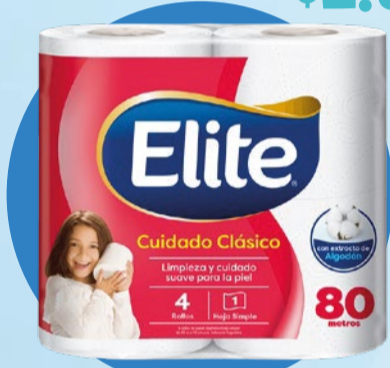
PAPEL HIGIÉNICO ELITE Clásico • x 4 u x 80 m x m: $ 9,37 (1) Cód. 1645150