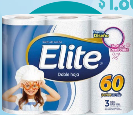
ROLLO DE COCINA ELITE Doble hoja • x 3 u x 50 paños x paño: $ 10 (1) Cód. 1545973