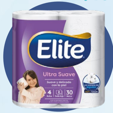
PAPEL HIGIÉNICO ELITE Ultra soft • x 4 u x 30 m x m: $ 20,83 (1) Cód. 1736748