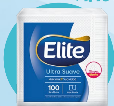
SERVILLETAS ELITE Ultra suave • x 100 u x u: $ 12 (1) Cód. 1743755