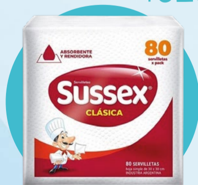
SERVILLETAS SUSSEX Clásica • x 80 u x u: $ 11,62 (1) Cód. 1708811