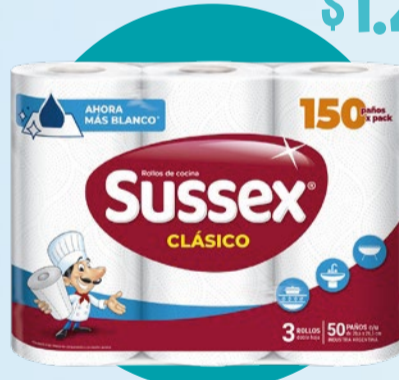
ROLLO DE COCINA SUSSEX Clásico • x 3 u x 50 m x m: $ 8,3 (1) Cód. 1600222