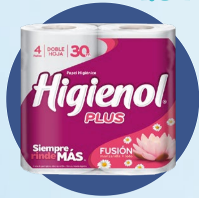
PAPEL HIGIÉNICO HIGIENOL Plus doble hoja • x 4 u x 30 m x m: $18,33 (1) Cód. 1640561