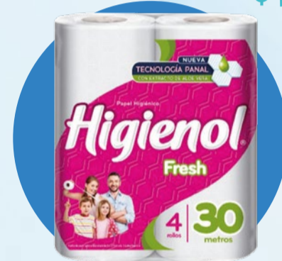
PAPEL HIGIÉNICO HIGIENOL Fresh • x 4 u x 30 m x m: $ 10 (1) Cód. 1746394