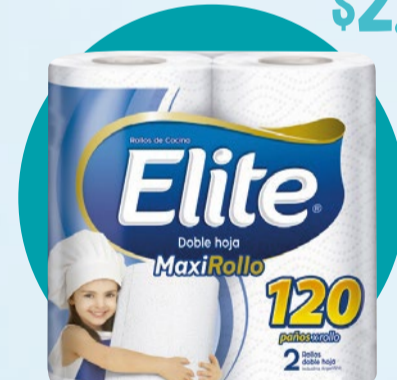
ROLLO DE COCINA ELITE MaxiRollo • x 2 u x 120 paños x paño: $1249,99 (1) Cód. 1656226