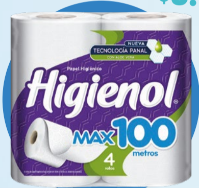
PAPEL HIGIÉNICO HIGIENOL Max • x 4 u x 100 m x m: $ 8 (1) Cód. 1743729