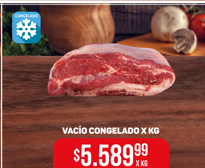
VACÍO CONGELADO X KG