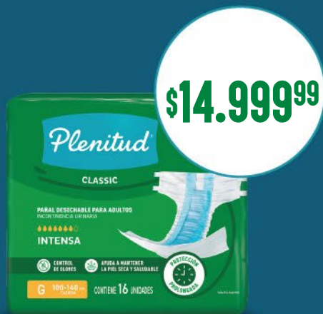
Pañal Plenitud Classic x16. Talles M. G. XG x u: $ 937,50