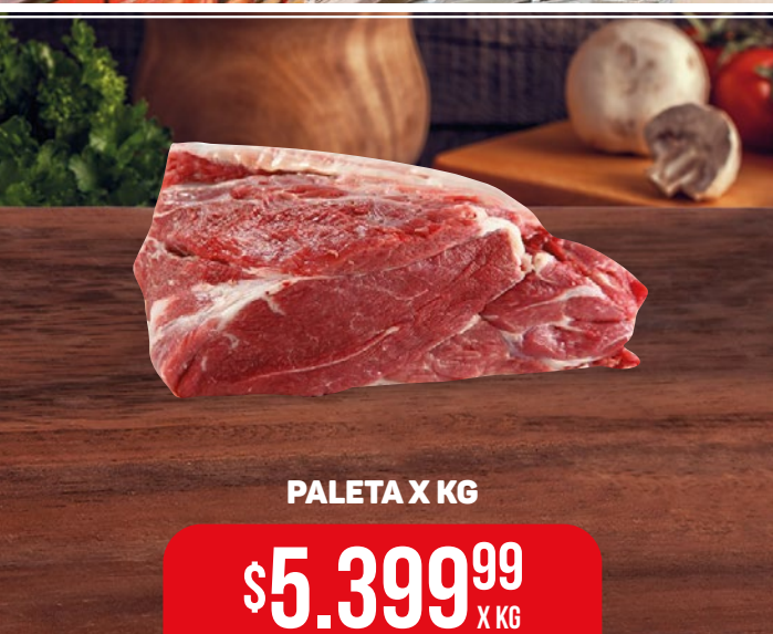
PALETA X KG