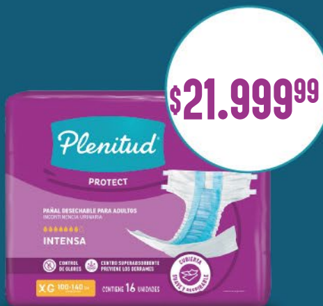
Pañal Plenitud Protect x16. Talles M. G. XG x u: $ 1.375,00