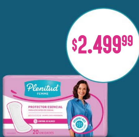
Protector Esencial x20. x u: $ 125,00