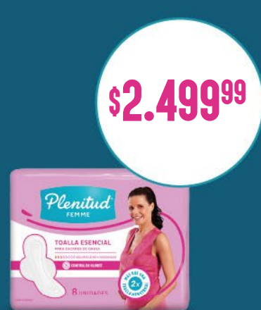
Toalla Plenitud Esencial x8. x u: $ 312,50