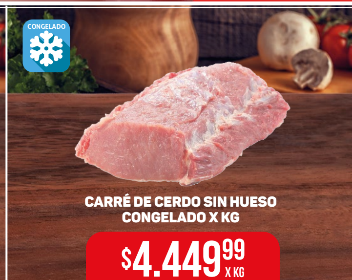
CARRÉ DE CERDO SIN HUESO CONGELADO X KG